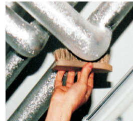
Strukturieren der Oberfläche